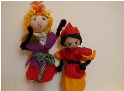
Atelier marionnettes au musée de la Vie romantique

Durée 1h ou 1h+1h30 (en 1 ou 2 séances) – 16 enfants maximum