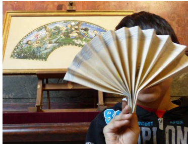
Atelier histoires en éventail au musée de la Vie romantique

D'étonnants personnages surgissent d'un objet magique, l'éventail des caricatures de la célèbre romancière George Sand. Les enfants créent et décorent un éventail en s'inspirant des surprenantes et amusantes histoires dévoilées par la conteuse !