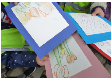
Atelier dessine-moi une fleur ! au musée de la Vie romantique

Les enfants partent à la recherche des fleurs du musée puis, s'inspirant des histoires choisies par la conteuse, ils imaginent et composent une carte souvenirs.