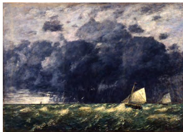
Eugène Boudin (1824-1898), Un grain, 1886, huile sur toile, 117 x 160 x 3 cm, Musée de Morlaix

Le musée de la Vie romantique invite à découvrir une thématique emblématique et fascinante de la première moitié du XIX e siècle et l'une des plus puissantes sources d'inspiration de l'univers romantique : les tempêtes et naufrages. Cette exposition souhaite ouvrir la programmation du musée au-delà de ses collections centrées sur la vie parisienne des salons en explorant la diversité picturale du romantisme et en mettant en lumière ce nouveau regard porté sur la nature et les paysages maritimes comme reflet de l'âme romantique.