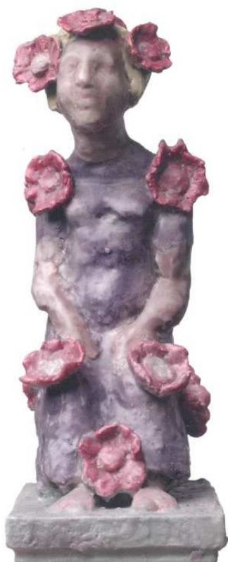
> MLP 307/01 © Markus Lüpertz "Flora", 2016 "Flora", 2016 Tirage 1/6 Plâtre coloré, cire.

INFORMATIONS www.museevieromantique.paris.fr