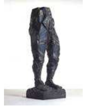
8. MLP 13/2 Markus Lüpertz "Standbein-Spielbein", 1982/ Bronze peint Tirage 2/3 320 x 100 x 100 cm © Jörg von Bruchhausen, Berlin