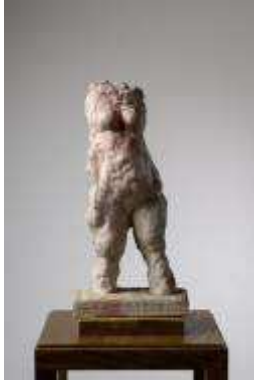
5. MLP 337/00 Markus Lüpertz "Akt", 2017 Argile colorée, cire 45,5 x 22,5 x 15 cm