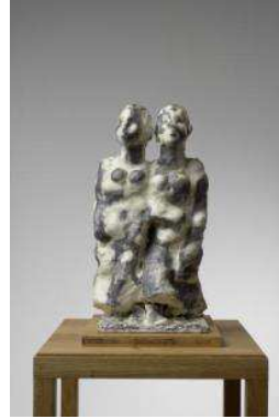
7. MLP 349/00 Markus Lüpertz "Zwillling", 2017 Plâtre coloré, cire 45 x 20 x 25 cm