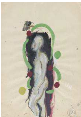
13. MLZ 735/00 Markus Lüpertz Ohne Titel (zu: Standbein - Spielbein), 1983 bis 1985 Stylo à bille, pastel, gouache sur papier 61,2 x 43,3 cm