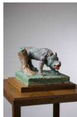
4. MLP 332/00 Markus Lüpertz "Cerberus", 2017 Plâtre coloré, cire 22 x 37 x 27,5 cm