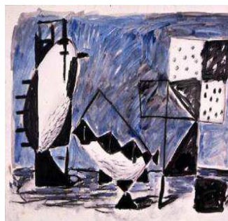
14. MLZ 1217/00 Markus Lüpertz Ohne Titel, ca. 1980 Acrylique, fusain sur papier 43,2 x 61 cm