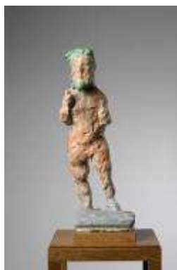
3. MLP 329/01 Markus Lüpertz "Poseidon", 2017 Plâtre coloré, cire 60 x 24,5 x 17,5 cm