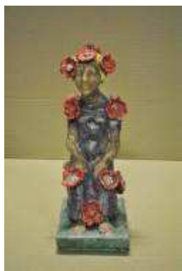
1. MLP 307/01 Markus Lüpertz "Flora", 2016 Tirage 1/6 Plâtre coloré, cire 35 x 13,5 x 22 cm

→ ADAGP Les visuels transmis sont soumis aux dispositions du Code de Propriété Intellectuelle et sont libres de droits pour le seul usage de la presse dans le cadre de la promotion de l'exposition avec l'aimable autorisation de l'ADAPG.