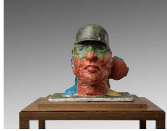
6. MLP 348/00 Markus Lüpertz , Ohne Titel, 2017 Plâtre coloré, cire 45 x 45 x 30 cm