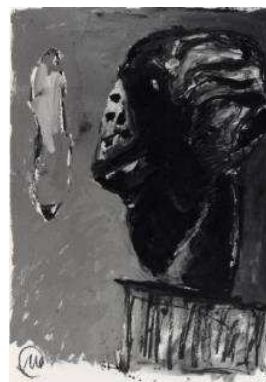
15. MLZ 774/00 Markus Lüpertz Ohne Titel (Selbstbildnis), 1987 Craie grasse, huile, gouache sur papier 100,3 x 70,5 cm