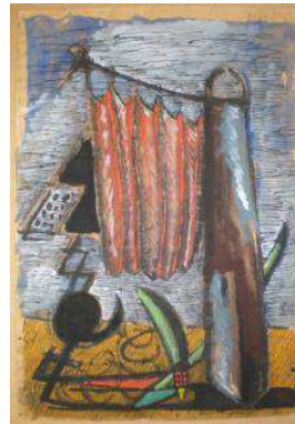
11. MLZ 419/00 Markus Lüpertz Ohne Titel (zu: Monument, dithyrambisch), 1976 Fusain, encre, gouache, huile sur papier 63 x 44,8 cm