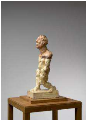
9. MLP 366/00 Markus Lüpertz "Hölderlin", 2018 Plâtre coloré, cire 47 x 16 x 20 cm