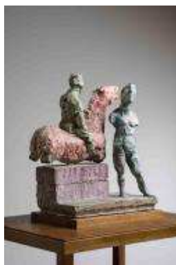
2. MLP 311/00 Markus Lüpertz "Denkmal 'Kaiser Karl Aachen' (Arbeit Nr. 2 Petrow Wodkin)", 2017 Plâtre coloré, cire 52,2 x 46 x 27 cm