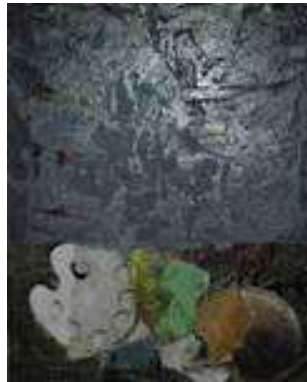
10. ML 2296/00 Markus Lüpertz Ohne Titel, 2018, Technique mixte sur toile 100 x 81 cm