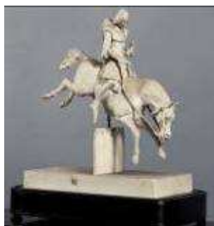
Marie d'Orléans, Cavalier sautant une palissade, vers 1835-1838 - Plâtre / Don 2012