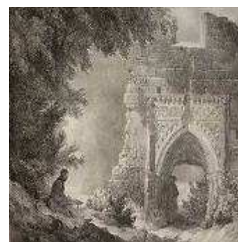
4. Alexandre-Évariste Fragonard (1780-1850), Ruines du palais de la Reine Blanche à Léry, 1824. Voyages pittoresques et romantiques dans l'ancienne France, Ancienne Normandie, 1825.