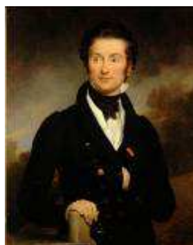
11. Tony Robert-Fleury, d'après Jean-Baptiste Paulin Guérin Paris, 1837-Viroflay, 1911 Portrait de Charles Nodier , Bibliothèque nationale de France, bibliothèque de l'Arsenal