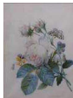
Eugénie Adélaïde Louise d'Orléans (1777-1847) Jeté de roses et de pensées au papillon, 1818 / Aquarelle sur vélin. Paris, musée de la Vie romantique.