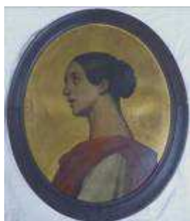
Ary Scheffer (1795-1858), Portrait de Pauline Viardot, 1 ère moitié XIX e siècle / Huile sur toile Paris, musée de la Vie romantique.