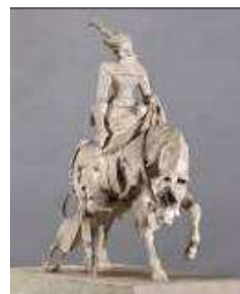
Marie d'Orléans, Amazone et son lévrier, vers 1835-1838 - Plâtre / Don 2012