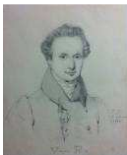
Jules-Claude Ziegler (1804-1856) Portrait de Victor Hugo, 11 février 1830/ Pierre noire, rehauts de craie blanche. Paris, musée de la Vie romantique.