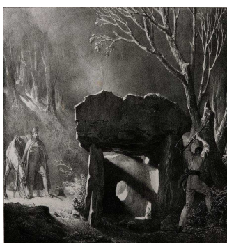
3. Alexandre-Évariste Fragonard (1780-1850), Monument druidique dans le bois de Trie dans la forêt de Lions. Dolmen, 1824. Voyages pittoresques et romantiques dans l'ancienne France, Ancienne Normandie, 1825.