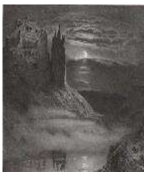
5. Léon Jean-Baptiste Sabatier (? -1887), Rochers de l'Aiguille , 1833. Voyages pittoresques et romantiques dans l'ancienne France , Languedoc, 1837.