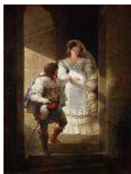
10. Jean-Baptiste Isabey (1767-1855) Escalier de la tourelle du Château d'Harcourt, 1827