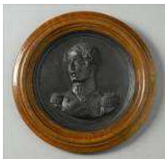
James Pradier Ferdinand-Philippe d'Orléans, 1842 Médaillon en bronze / Don 2011