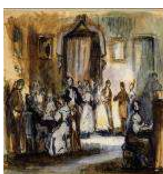
7. Tony Johannot (1803-1852). "Soirée d'artiste". Bibliothèque nationale de France, bibliothèque de l'Arsenal