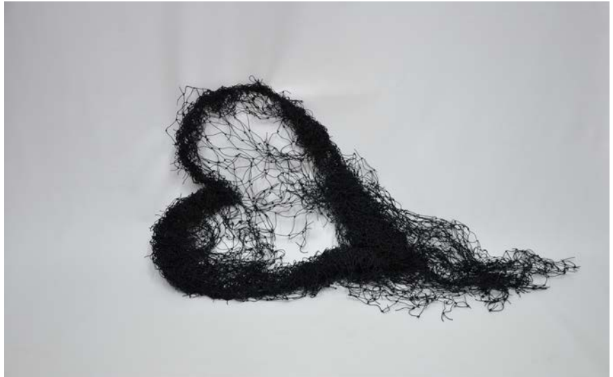
↑ Annette Messenger, Cœur au repos , 2009, fil de fer, filet noir, 43 x 100 x 17 cm, Collection Antoine de Galbert, Paris