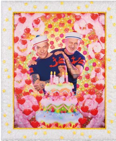
↑ Pierre et Gilles, 40 ans – Autoportrait , 2016. Photographie imprimée par jet d'encre sur toile et peinte, 123,5 x 102 cm. Pièce unique.